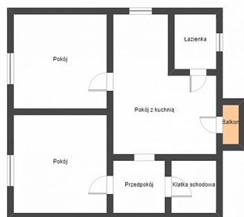
RZUT PIERWSZEGO PIĘTRA wysokość: 277